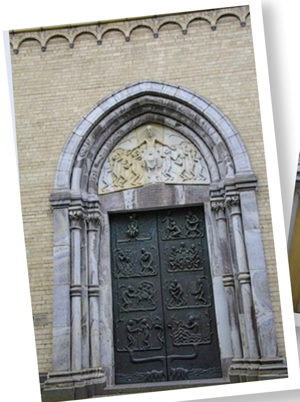
St. Kunibert (Pfarrkirche)